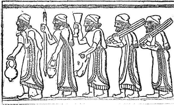
ווי די אידען טראָגען צינען צו די הימער.

פאמפעאוס איז מיט זיין ארמעע געגאנגען אויף ירושלים